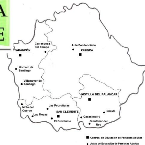
Mapa sectores CEPAs Cuenca